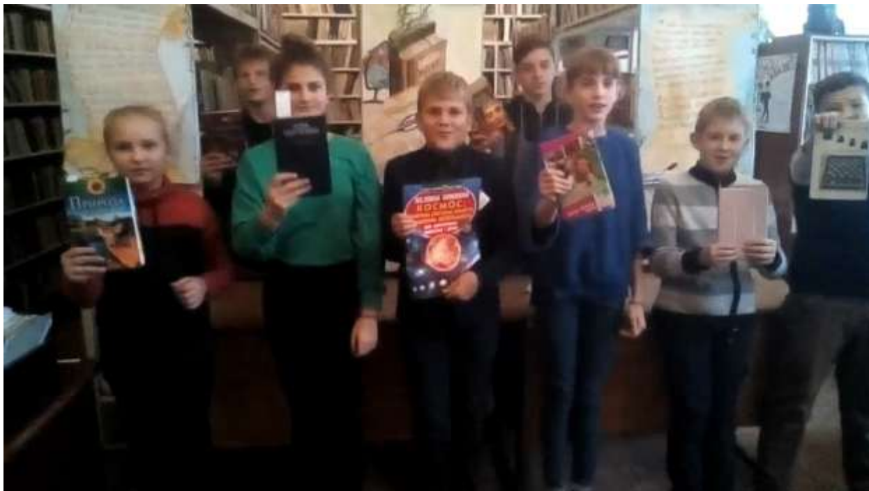
Флешмоб «Відкриваємо свою книжку» (див. відео на сайті бібліотеки гімназії №7)

Поряд з традиційними заходами які проводить бібліотека - екскурсії, книжкові виставки, літературні години, вікторини, конкурси, бесіди, актив бібліотеки приймає участь у нових формах - флешмобах і зйомках відео при проведенні щорічного «Всеукраїнського місячника шкільних бібліотек» та «Всеукраїнського тижня дитячого читання».